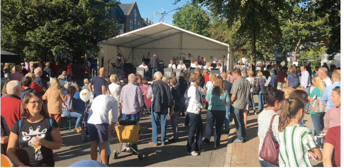
Oben: Seit 2015 organisiert die BIG im September das Straßenfest

Zu den wichtigsten Aufgaben der BIG gehört die Kommunikation: Wir fördern die Vernetzung untereinander, schaffen mit Veranstaltungen Aufmerksamkeit für Blankenese und rücken mit Aktionen und Social-Media-Posts die Gewerbetreibenden in den Fokus.