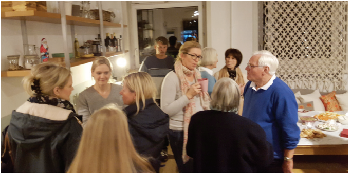
Oben: Der Lebendige Adventskalender bei Coco-Mat

Links: Die Blankenese Interessen-Gemeinschaft postet regelmäßig bei der Nachbarschaftsplattform nebenan.de und erreicht damit rund 5000 Haushalte in der direkten Umgebung